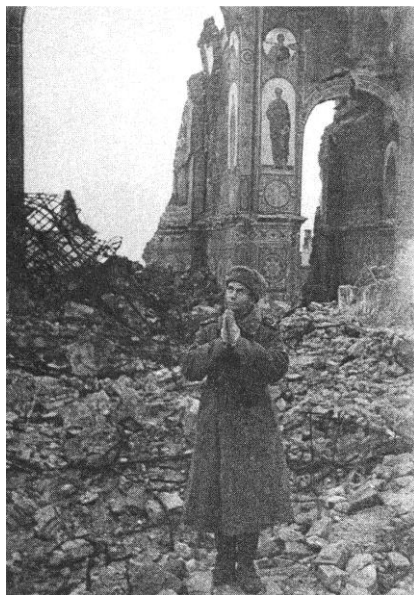
Офіцер 1-го Українського фронту у Києво-Печерській Лаврі. Листопад 1943 р.