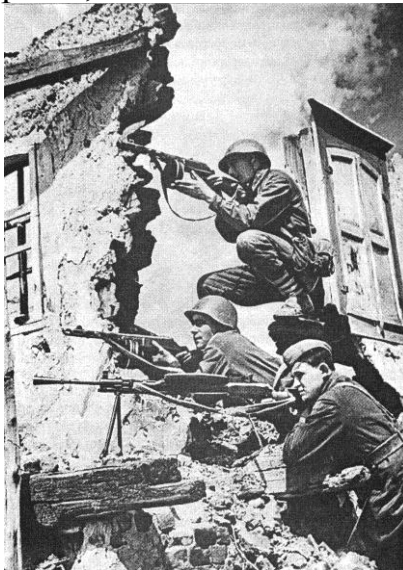
Вуличні бої у Харкові. Літо 1943 р.