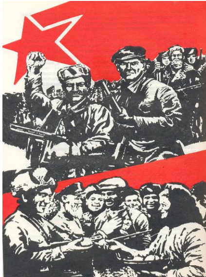
Дружба народів СРСР в партизанському русі. Художник Є.В.Попов.