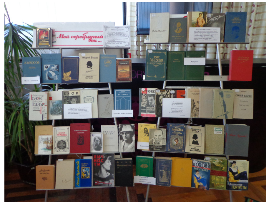
Книжкова виставка «Мой Серебряный век»