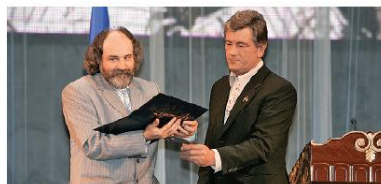
Під час вручення ордена «За заслуги»