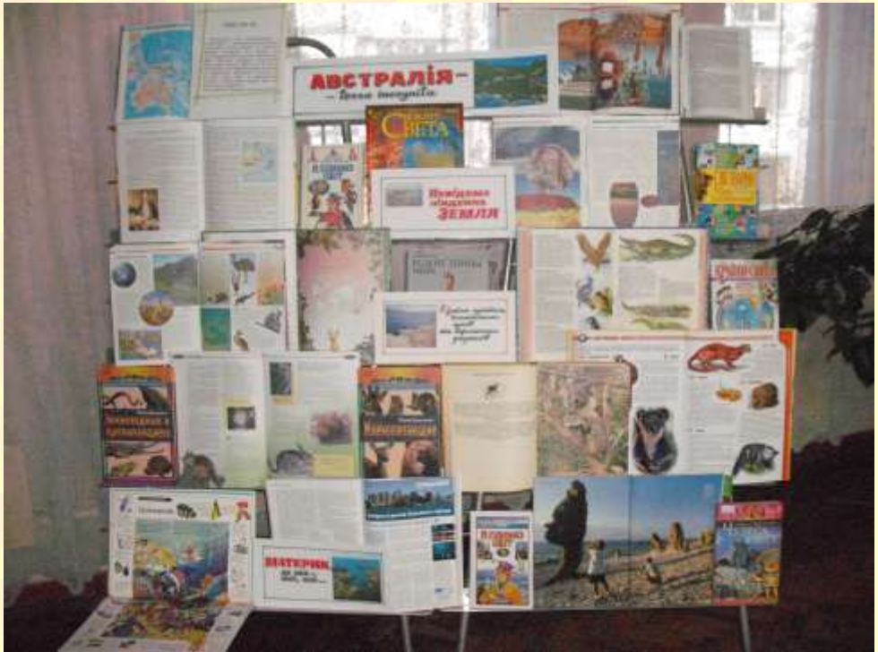
Книжкова виставка «Австралія – terra incognita»