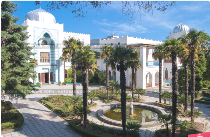
Дворец Дюльбер. Крым. Архитектор Краснов Н.П.

1. Ливадія : [общая характеристика курорта, в т. ч. биография архитектора Краснова Н. П.] // Крым : исторический путеводитель / Н. И. Шейко, Н. В. Маньшина. – М. : Вече, 2006. – С. 136-143.