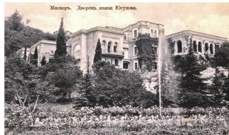
Юсуповський палац в Корєїзі. Побудований в неороманському стилі з елементами італійського ренесансу. Архітектор Краснов М. Фото 1914 року

6. Мармурова печера // Україна, якою ми мандруємо. 7 природних чудес України / упоряд. Царенко Ю. – К. : Геопринт, 2008. – С. 8–9 : фото.