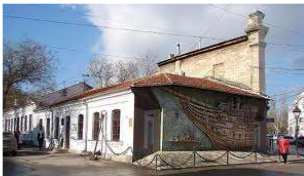
Музей Александра Грина в Феодосии.

«В любимой Грином Феодосии, в доме, где он жил, открыт волшебный музей... Музей парусников и шхун, где из угла выступает нос корабля, где живут морские фонари, канаты и подзорные трубы, унося с собой посетителей в карту Гринландии с новыми мысами и проливами, с городами Гель-Гью, Лисс, Зурбаган...».