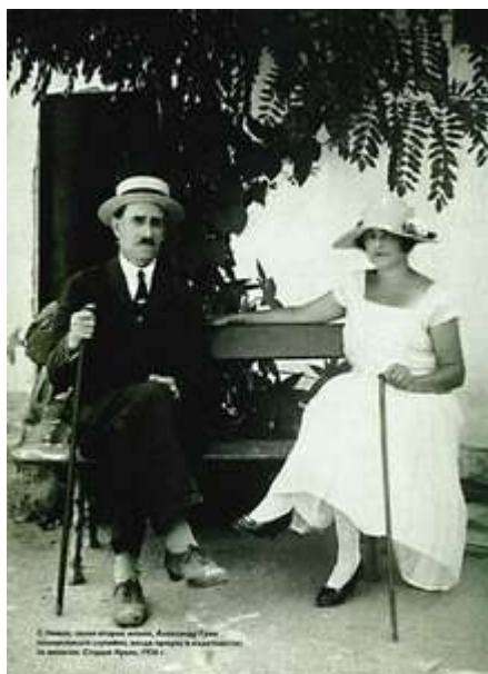
Александр Грин и Нина Николаевна, 1926 г.