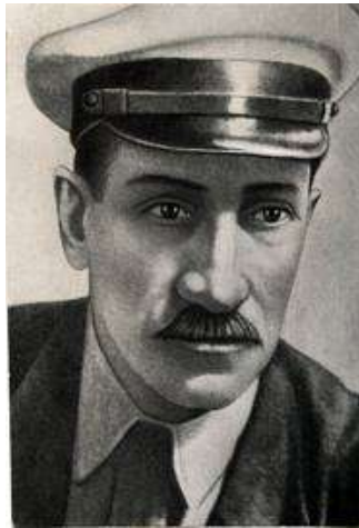
Грин (Гринеvский) Александр Степанович