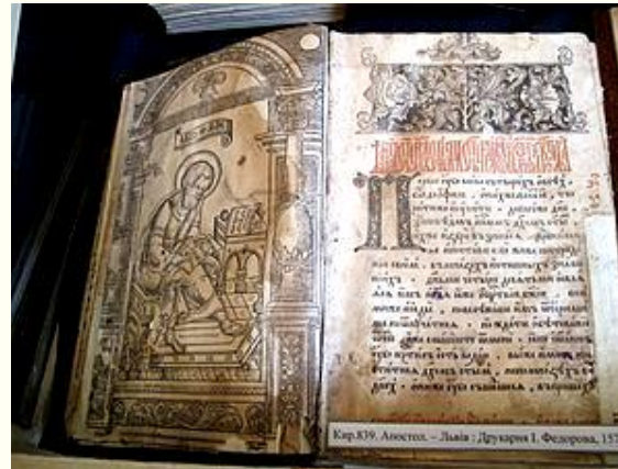
Апостол, 1574 рік

Восени 1572 р. він вирушає до Львова, найбільшого тогочасного економічного та культурного центру України. Першою друкованою книгою , яка побачила світ на українських землях 15 лютого 1574 року , став львівський Апостол .