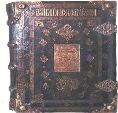
Острозька Біблія, 1581 р.

Наприкінці того ж року друкар перебирається на Волинь. Тут магнат Речі Посполитої князь Костянтин-Василь Острозький заснував першу у східних слов'ян вищу школу — славнозвісну Острозьку слов'яно-греко-латинську академію та запланував видати першу у світі повну Біблію церковнослов'янською мовою.