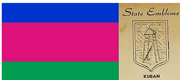
Прапор і герб Кубанської Народної Республіки

Нову назву обрано для відновлення історичної пам'яті про козацьке державне утворення на Кубані.