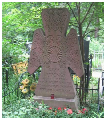
Могила Алли Горської

Похована Горська 7 грудня 1970 року на Берковецькому кладовищі міста Києва.