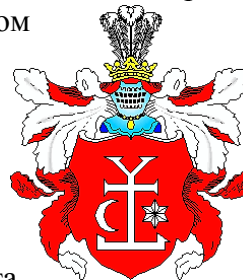
Герб гетьмана Мазепи

Отриманий досвід в міжнародних справах, впливові зв'язки в російських урядових колах, вольові якості характеру, блискуча європейська освіта та бездоганні манери допомогли Івану Мазепі у 1687 році стати гетьманом . Він був першим українським гетьманом, який незмінно тримав гетьманську булаву протягом майже 22 років (1687-1709) . Цей період характеризувався економічним розвитком України-Гетьманщини, піднесенням церковно-релігійного життя та культури.