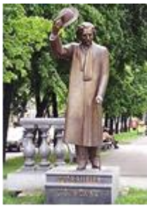
Пам'ятник Шолом-Алейхему у Києві

1997 р. – пам'ятник письменнику у Києві та у Богуславі.