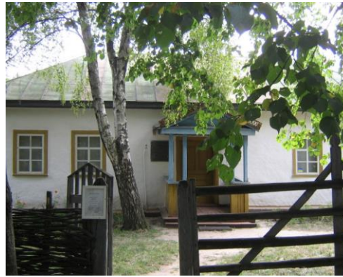
Садиба-музей Шолом-Алейхема в Переяславі

Шолом-Алейхем – Мир Вам [Електронний ресурс] // Український інтерес. – Електрон. текст. – Режим доступу: https://uain.press/blogs/sholom- alejhem-mir-vam-1004517 , вільний (дата звернення: 05.03.2024). – Назва з екрану. – Мова укр.